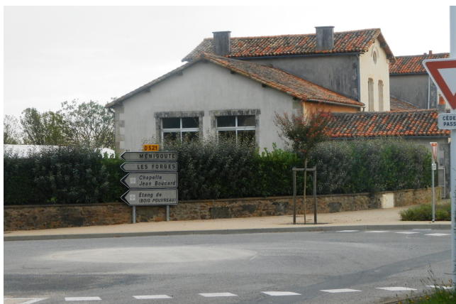
Le giratoire sur la place de la Mairie a été formalisé cet été.

Giratoire : l'État nous a accordé une aide de 2500 €, s'ajoutant à celle obtenue du Conseil Général de 2990 € soit un total de 5450 € pour ce seul dossier. Les travaux du giratoire ont ainsi été effectués en Juillet. La pose des coussins berlinois par les services municipaux aux entrées et sorties du bourg aura lieu courant du mois de Septembre. Les emplacements ont été définis en accord avec les services du Département.