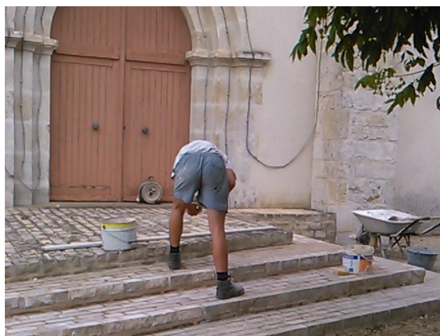
Les marches de l'église ont été refaites et sont agrémentées d'une rampe d'accès

Réfection des marches de l'église : les travaux ont été faits en Août par une entreprise du village. L'occasion a été saisie de créer une rampe d'accès pour les personnes à mobilité réduite.