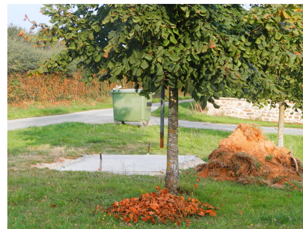
L'abribus du Breuil doit être finalisé avant la mi-septembre.

Abribus : les deux abribus de la Boucherie et du Breuil sont en cours de construction. La commune assume seule la réalisation du premier et s'associe à la commune de Ménigoute pour le second puisque quelques habitations de ce hameau sont juridiquement situées sur le territoire ménigoutais.