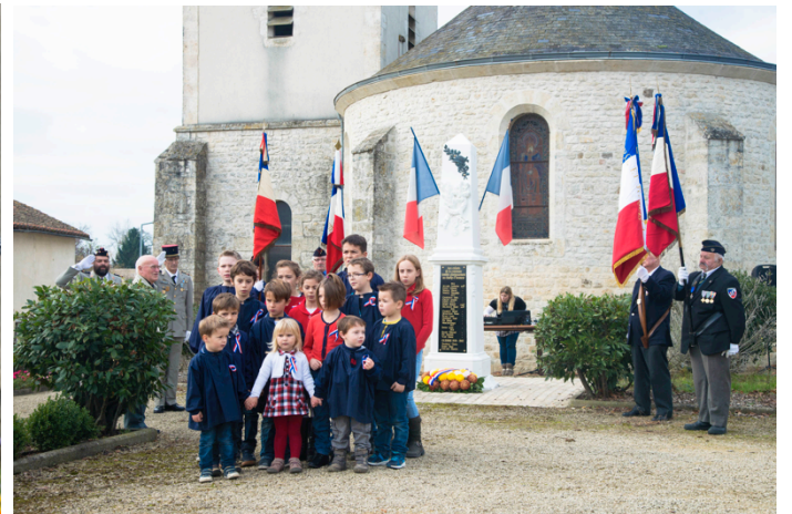
Le 11 Novembre, les enfants sont encore plus nombreux pour la