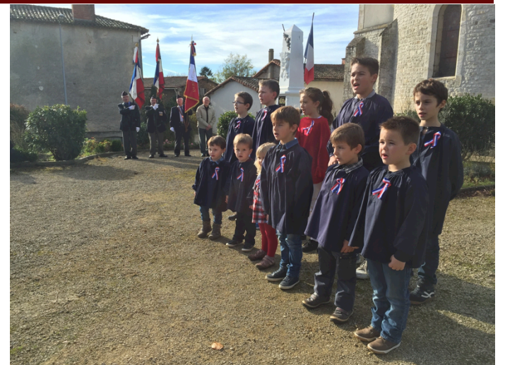
Le 7 Nov, les enfants chantent la Marseillaise lors de l'inauguration du Monument aux