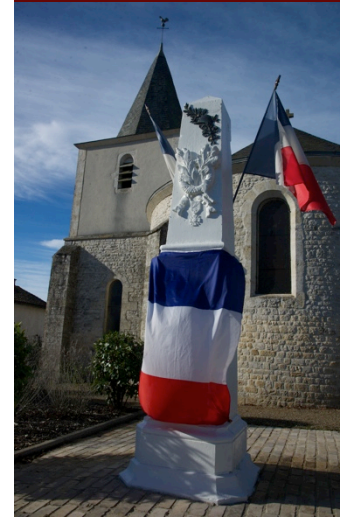
Le drapeau cache le nom des Poilus.

Un DVD Souvenir est en vente (12 euros). Infos : Évelyne David : 05.49.69.04.16