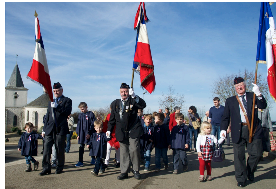
Les enfants et les anciens combattants, main dans la main, en route pour la salle des fêtes.