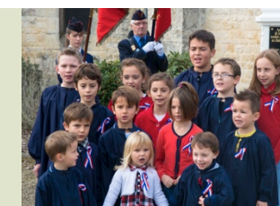
La Marseillaise chantée par les enfants

3 – Album. Une sélection de photos en l'honneur du lien intergénérationnel.