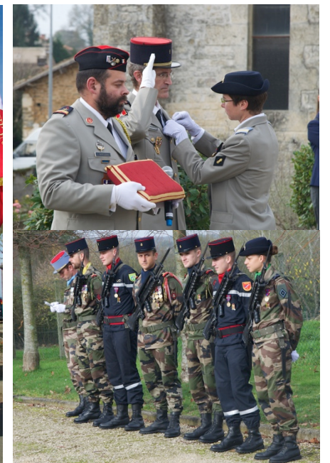
ci-dessus : la remise de médaille et le Piquet d'honneur.