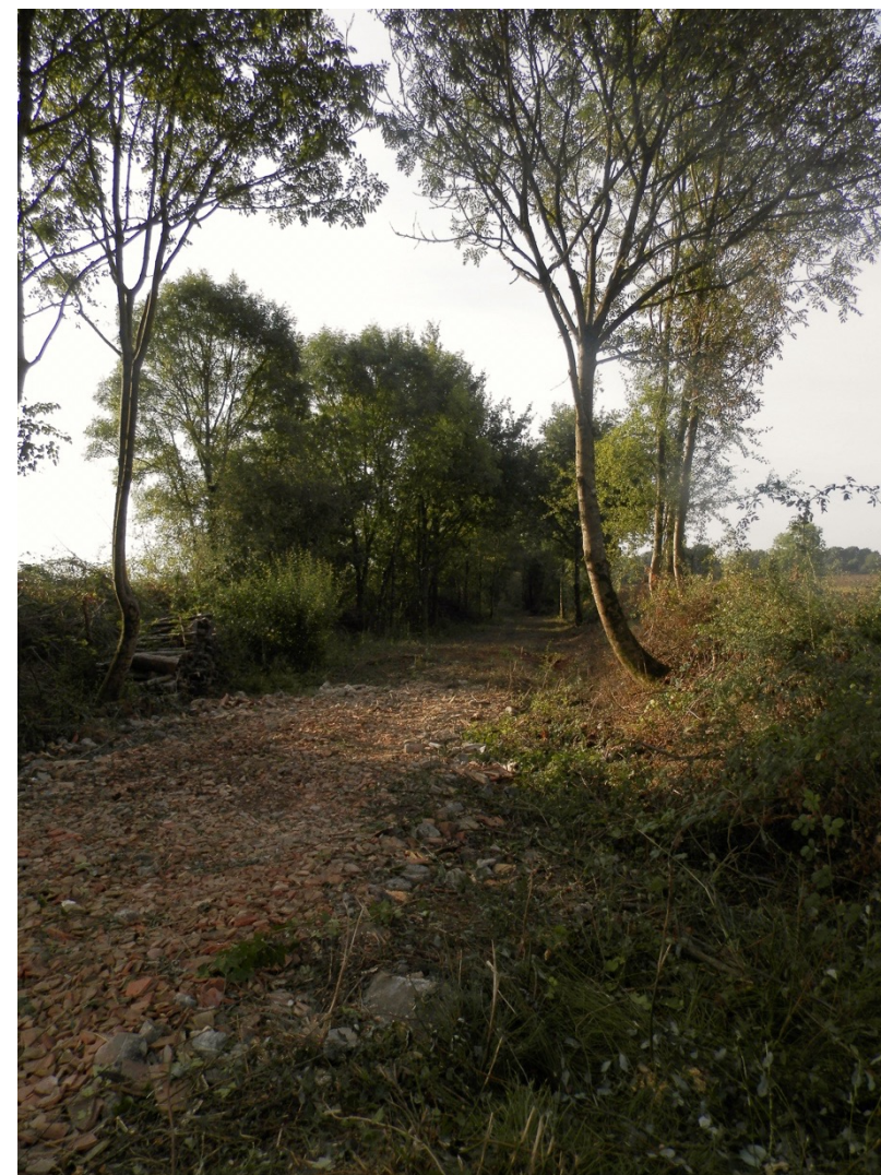
Le chemin reliant le hameau du Breuil à la Monégrière a été élargi de 8 mètres

L'an prochain, si le temps le permet, un autre chemin qui poursuit celui qui a été rouvert, et qui conduit à la route de Soudan, à hauteur de la Guilboterie, sera lui aussi rouvert.