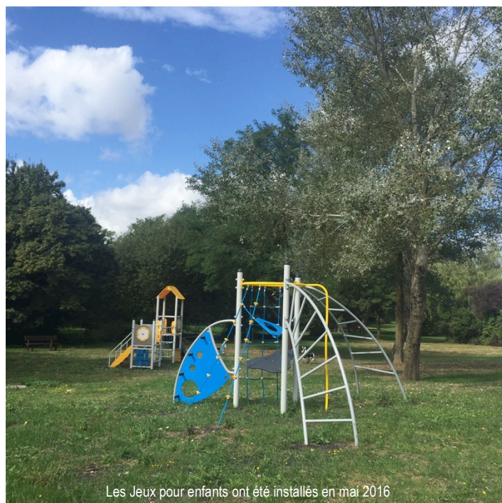
Les Jeux pour enfants ont été installés en mai 2016