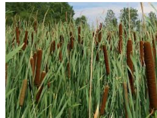
C'est une roselière qui filtrera les eaux usées du bourg

Cette opération sera complétée d'une part par la fin de l'enfouissement de tous les réseaux du bourg (électricité, téléphone et éclairage public), opération qui sera largement financée par le SIEDS (syndicat d'électricité départemental) et d'autre part par une requalification des paysages urbains du bourg dans le cadre d'une réflexion menée conjointement avec la population.