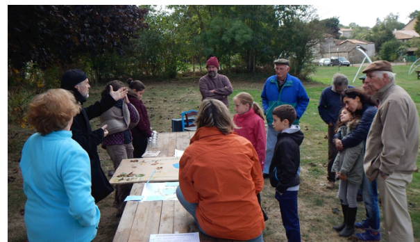
L'aménagement du parc de l'étang en concertation avec les habitants représente la plus grosse part du budget 2017