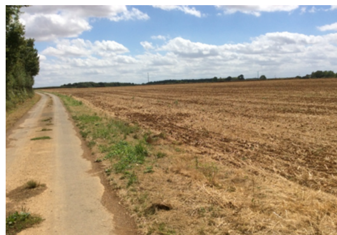
Chemin à Saint-Germier sans haies ni buissons.