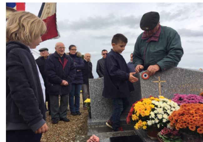
Les enfants de Saint-Germier mobilisés pour le 11 Novembre 2018