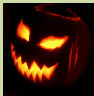
Jeudi 31 Octobre Tous les enfants du canton sont attendus pour fêter Halloween à la salle des fêtes.