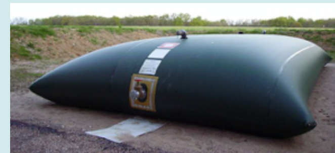
Des réserves à incendie sont à prévoir dans 4 hameaux du village (source wikipedia).

Quelle ne fut pas notre surprise début Juillet 2019 de recevoir une lettre du Préfet nous informant simplement du fait que notre dossier n'était pas retenu, et ce sans aucune explication, explication bien entendu demandée dès le 8 Juillet, lettre restée à ce jour sans aucune réponse.