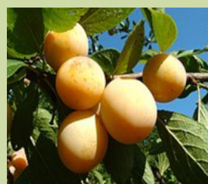
Vendredi 8 Novembre Les aînés sont attendus pour un repas local et de saison.