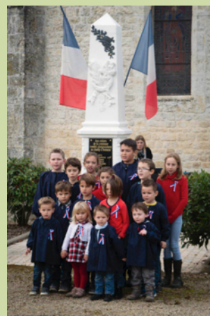
Lundi 11 Novembre La cérémonie de l'armistice 1914-1918 se tiendra devant le monument aux morts à 10h45.