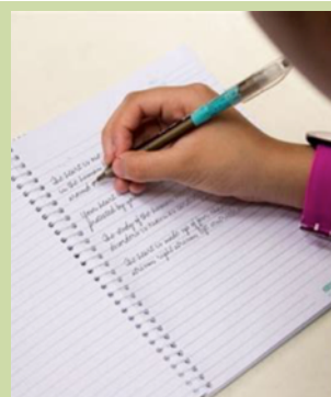
Mercredi 25 Septembre Le CSC attend les jeunes et leur famille pour une concertation à la salle des fêtes à Vasles.

27 tonnes d'enrobés à froid ont été déposées sur les routes communales ainsi que 8 tonnes d'enrobés chauds puis 15 tonnes de graviers sur les chemins.