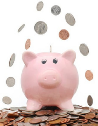
UNE CAGNOTTE POUR DIRE NON AU PARC DE PAMPROUX

L'association SOUFFLE DU BOCAGE DE SAINT-GERMIER dont le but est de s'associer à la démarche du conseil municipal et de lui apporter les fonds nécessaires à son action juridique, a ouvert une cagnotte en ligne. Le but est de réunir le montant de la rémunération d'un avocat spécialisé pour défendre la population et plus largement l'ensemble des riverains qui seront impactés par le futur parc éolien de Pamproux. Le montant est de 6000 euros. La défense par voie d'avocat est une obligation pour déposer un dossier à la Cour administrative d'appel de Bordeaux où est effectué le recours contre le projet éolien. Si vous souhaitez participer à la collecte, rendez-vous sur le site internet saintgermier79.com ou venez en mairie pour un don par chèque.