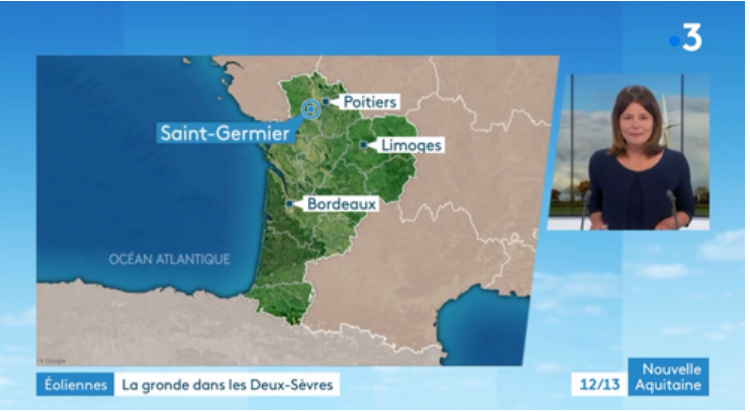
L'ACTION DU VILLAGE PRÉSENTÉE AU JOURNAL TÉLÉVISÉ DE FRANCE 3 POITOU CHARENTES LE 14 AVRIL 2021

Cette option impose le recours à un avocat pour un montant de 6000 € minimum. Une association s'est donc créée - SOUFFLE du BOCAGE de SAINT-GERMIER - dont le but est de s'associer à la démarche du conseil et de lui apporter les fonds pour financer L'action (voir encadré ci-dessous).