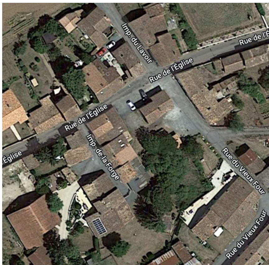
CAPTURE GOOGLE MAP DE LA PLACE DE LA FUTURE HALLE