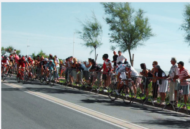
LE TOUR CYCLISTE POITOU-CHARENTES TRAVERSA SAINT-GERMIER VENDREDI PROCHAIN ENTRE 12H ET 13H30.

Vendredi 23 août, le tour cycliste Poitou-Charentes va traverser notre village dans le cadre d'une étape Fontaine le Comte-Poitiers. Les coureurs arriveront de Ménigoute pour tourner vers la rue de l'Église et emprunter ensuite la route du Breuil pour poursuivre à la Boucherie vers Bois Pouvreau. La caravane ouvrira la voie vers 12h et sera suivie par les coureurs vers 13h10. Des contraintes de circulation seront imposées et des ralentissements sont à prévoir. Il est donc conseillé de ne pas prendre cet itinéraire à cet horaire.