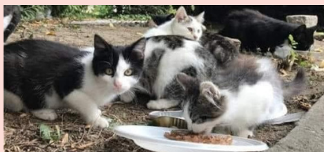
L'ARTICLE 120 DU RÈGLEMENT SANITAIRE DÉPARTEMENTAL (RSD) INTERDIT LE NOURRISSAGE DES CHATS ERRANTS SUR LA VOIE PUBLIQUE ET SUR LE DOMAINE PRIVÉ.