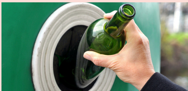
LES BOUTEILLES ET BOCAUX EN VERRE DOIVENT ÊTRE GLISSÉS DANS LE BAC ET NON À SA BASE.