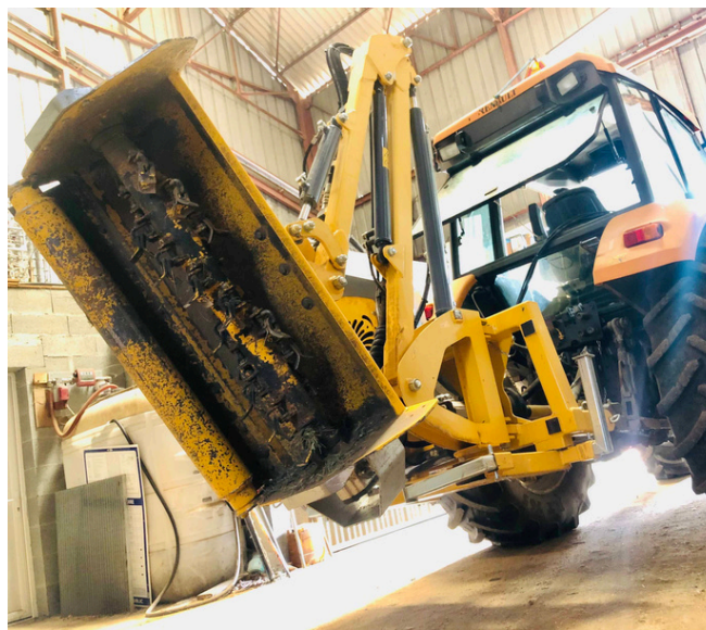
UNE ÉPAREUSE À MARTEAUX A ÉTÉ ACHETÉE POUR EFFECTUER LES TRAVAUX D'ÉLAGAGE CONFISÉS CHAQUE ANNÉE À DES PRESTATAIRES EXTÉRIEURS.