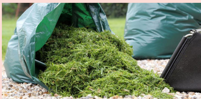
LA TONTE DES PELOUSES DOIT ÊTRE PORTÉE EN DÉCHETTERIE DE MÉNIGOUTE OU PAMPROUX.

Enfin, les dégradations faites dans le parc de l'étang fin juillet ont été signalées à la gendarmerie, qui a interpellé les auteurs et dressé un procès verbal. Le maire a déposé plainte et une surveillance hebdomadaire sera assurée par les forces de l'ordre.