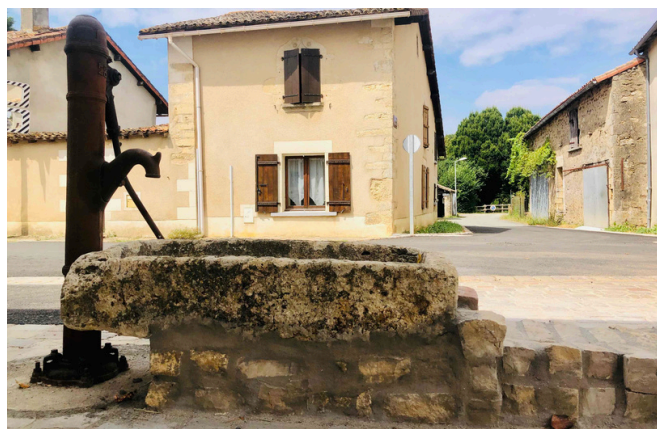
LA NOUVELLE POMPE ET SA CUVE EN PIERRE RAPPELLENT L'IMPORTANCE DE L'EAU DANS LE VILLAGE.

Le budget 2024, adopté à l'unanimité le 12 avril, fut sûrement l'un des plus difficiles à arbitrer. En effet, même si les travaux de réaménagement de la place du village avaient été actés de longue date pour un montant de 117 600€, il n'était pas prévu de rénover le réseau pluvial. Pourtant, un diagnostic effectué par les services de la CCPG à l'automne 2023, a découvert des canalisations déjà très endommagées avec des fissures, des racines et des buses cassées. Ces canalisations n'auraient pas supporté les travaux de réaménagement de la place et notamment le passage répété des engins de chantier.